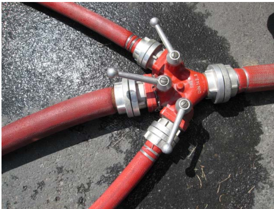
Küresel vanalı Fikrasyon