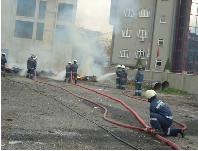
Fikrasyon kullanılarak tek koldan gelen suyun üç koldan dağıtılması