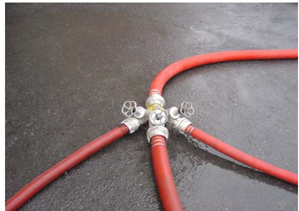
Şiber vanalı fikrasyon