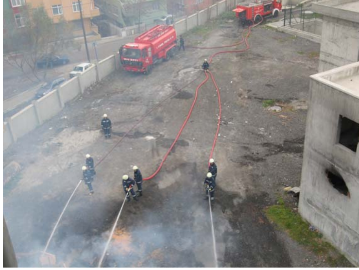
Fikrasyon kullanılarak tek koldan gelen suyun üç koldan dağıtılması