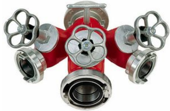
Şiber vanalı fikrasyon