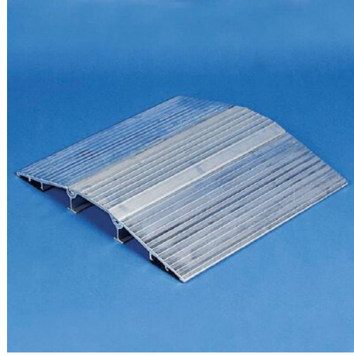
Alüminyum Hortum köprüsü