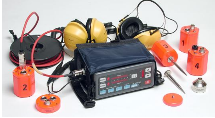
Delsar Enkaz altı canlı arama dedektörü

KULLANIM AMACI : Yaşanan afetlerden sonraki yıkımlarda enkaz altı canlı arama için geliştirilmiş bir sistemdir. Bina göçmelerinde, toprak kaymalarında maden ocaklarındaki göçme ve çökmelerde kullanılır.