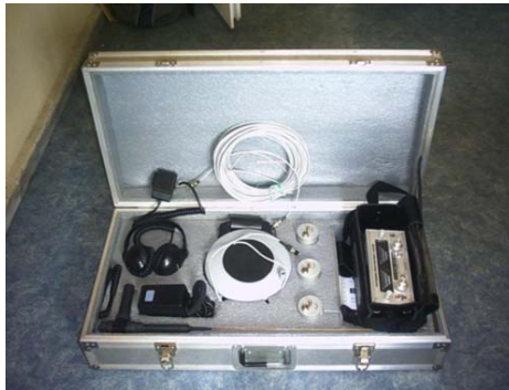
ENTERCOM 2000 Enkaz altı Canlı arama ve dinleme dedektörü