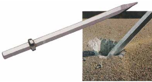
Çivi Uç 386 mm