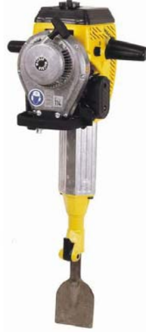
WACKER Benzinli kırıcı

Kırıcının üstünde bulunan çalıştırma ipini yukarıya doğru çekerken motoru aşağıya doğru iterek cihazı çalıştırabiliriz. Çalıştırdıktan sonra elektronik tetiğine basarak kullanırız.