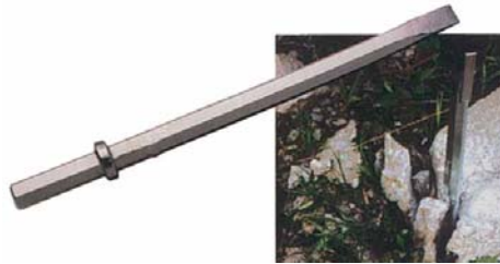
Keski Uç 386 mm