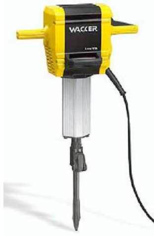
WACKER Elektrikli kırıcı

Bu kırıcının kullanımı son derece kolay ve pratik olup kullanıcı için alternatif kırıcı uçları mevcuttur. Betonların kırılmasında son derece etkilidir. Kırıcının prizini jeneratör veya şehir şebekesine( 220 VOLT ) bağlayarak kırıcıyı kullanıma hazır hale getirebiliriz. Elektronik tetiğine basarak kullanırız.