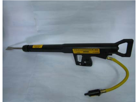
Havalı Kırıcı, Hava tabancası