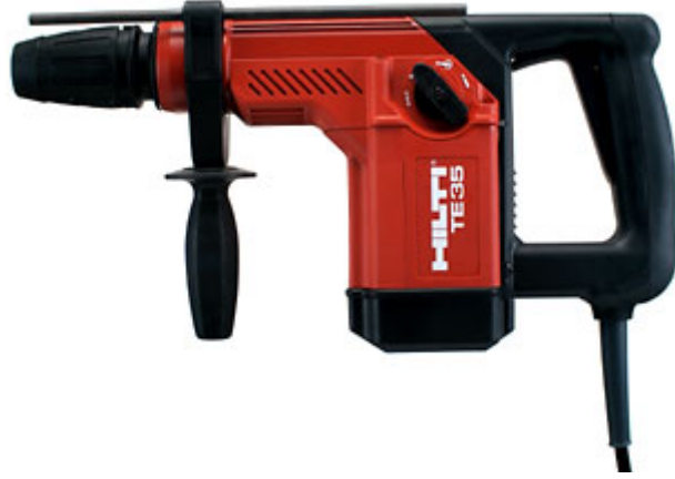
HILTI TE 55 Delici ve Kırıcı