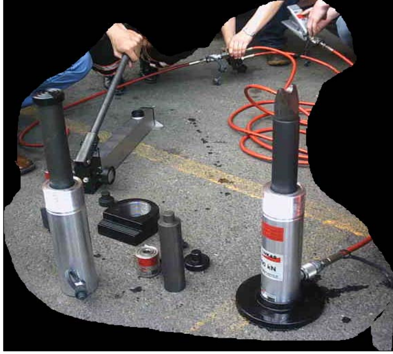
Hidrolik silindir aksesuarlarının kullanım