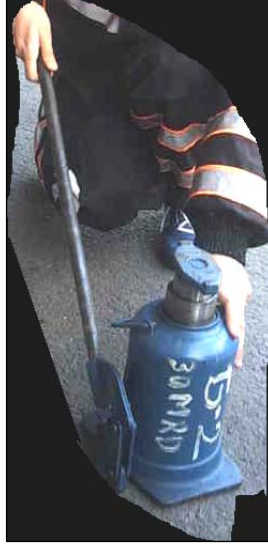
Hidrolik kriko ve açılmış hali ( 5–10–20–40 ton ve daha yüksek tonajlı olanları vardır)